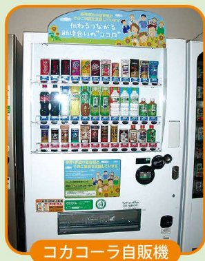
コカコーラ自販機