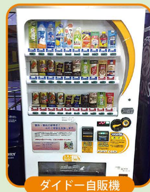
ダイドードリンコ自販機