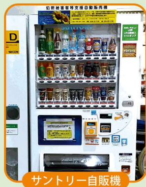
サントリー自販機