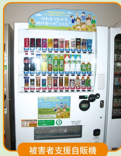
被害者支援自販機