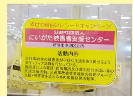
イオン新潟南ショッピングセンター投函ボックス(食品売り場前に設置)